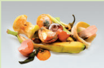
Obst- und Gemüseabfälle, Eierschalen und Rüstabfälle