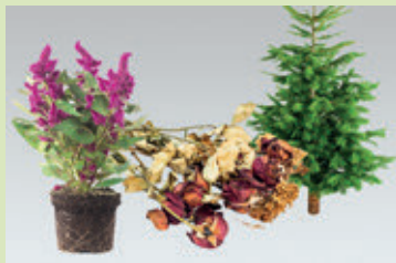
Blumensträuße, Christbäume und Topfpflanzen